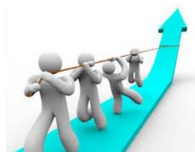
Együttműködés és csapatszellem